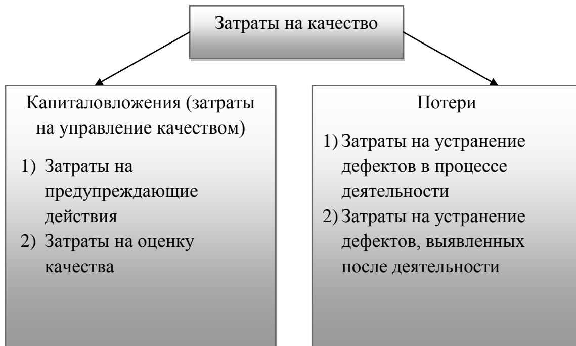
Рис.1. Структура затрат на качество

подразделяются на капиталовложения (планируемые затраты на управление качеством) и потери (непредвиденные затраты)[2].